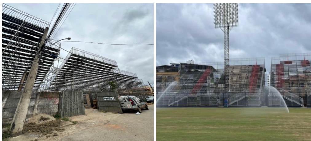
Foto 07 e 08 - Acesso ao portão 2 e arquibancada oeste.

R: Possui 2 portões para veículos. Sendo: um Portão de Serviços e um portão de apoio no Setor Leste.