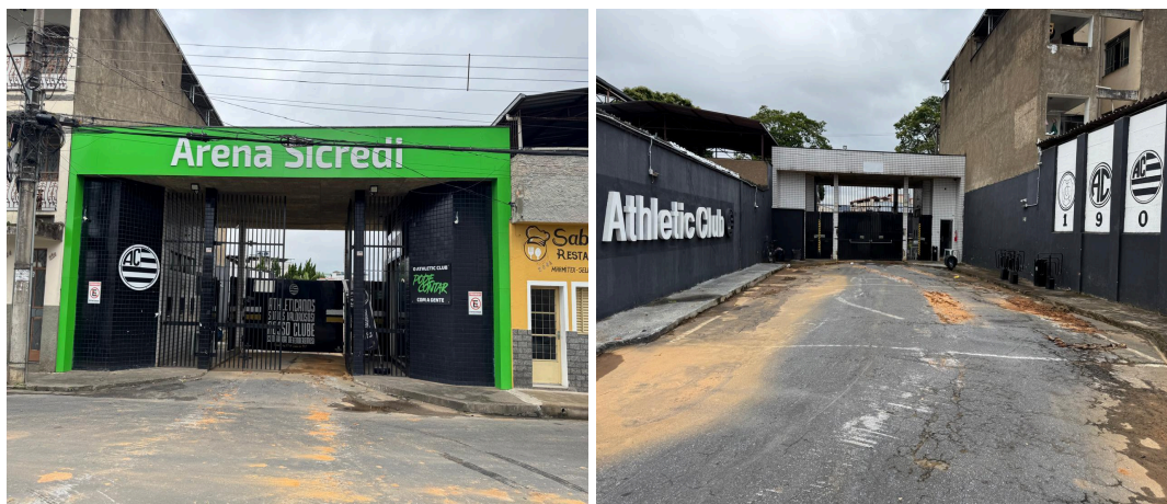
Fotos 01 e 02 - Acesso externo e interno do portão 01

R: Possui 7 portões, sendo 5 portões em condições de uso para o público geral: portão 1 (sul), portão 2 e 2A (oeste), portão 3 (leste) e portão 4 para visitante (norte). Existe ainda o portão de serviços e o portão das delegações (norte).