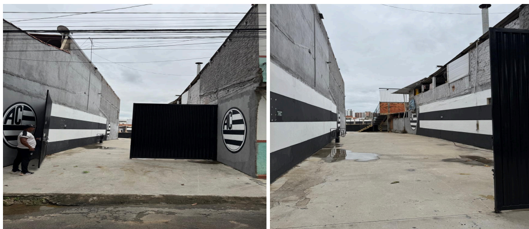
Fotos 05 e 06 - Acesso externo e interno - Portão 03

Verifica-se que o portão 2 e 2A (oeste) estão em fase final de acabamento das obras. Dessa forma, o responsável pelo policiamento na primeira partida deverá vistoriar o local para atestar as plenas condições de segurança para os torcedores e profissionais empregados.