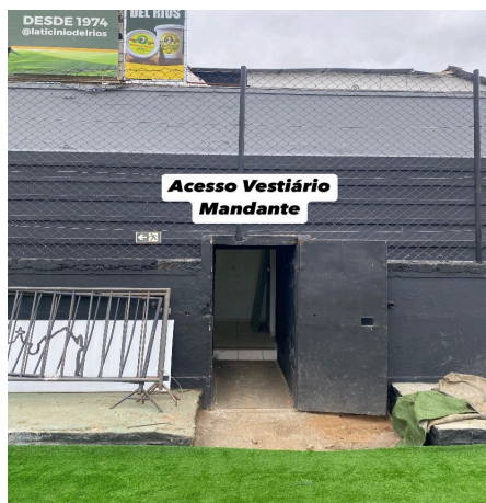
Foto 12 - Acesso vestiário do clube mandante

3.3.16 Existe fluxo sem obstrução para a remoção de atletas pelas ambulâncias?