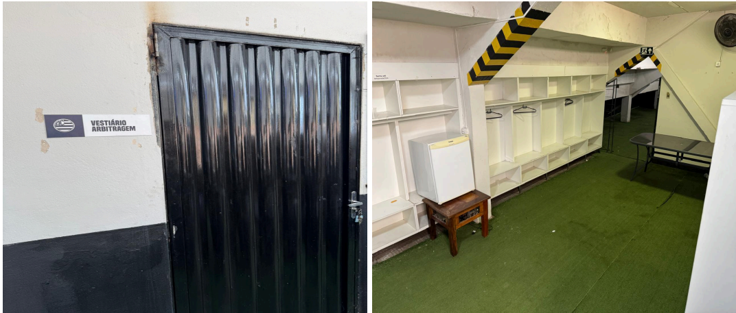
Foto 10 - Vestiário da equipe de arbitragem

3.3.14 O acesso da arbitragem para o campo possui: