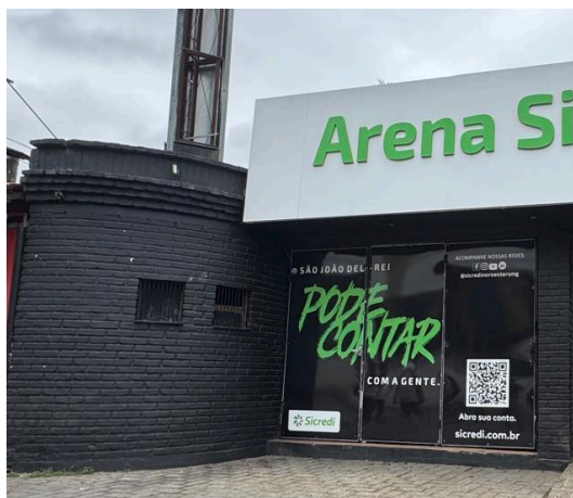
Foto 09 - Acesso externo e interno da Delegação Visitante

O acesso das delegações local e visitante se dá por um portão localizado no setor norte. O acesso é seguro, entretanto demanda isolamento e presença de policiamento e segurança privada no momento de chegada e saída das delegações, devido a proximidade com o portão do torcedor visitante.