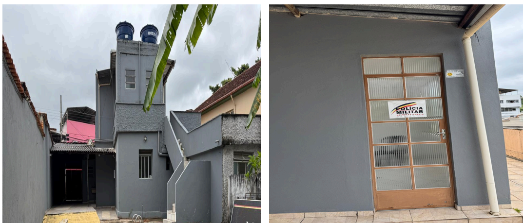
Foto 15 e 16 - Sala de REDS