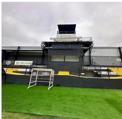
Foto 13 - Central de Comando e Controle Operacional

R. Sim, possui um local ao lado das cabines de rádio, com boa visão para as arquibancadas e campo de jogo.