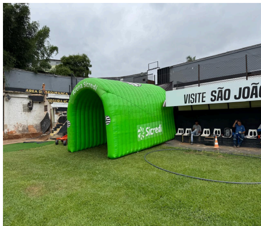
Foto 11 - Túnel Inflável

3.3.15 O acesso do time mandante ao campo de jogo se dá no setor norte, logo abaixo da torcida visitante, sendo necessário o uso de cobertura no local.