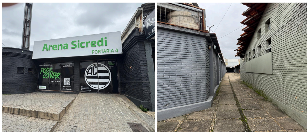
Fotos 03 e 04 - Acesso externo e interno - Portão Visitante