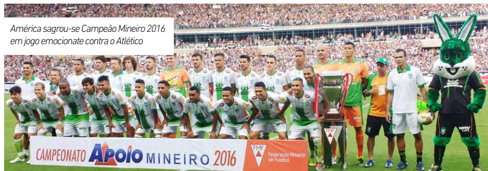
América sagrou-se Campeão Mineiro 2016 em jogo emocionante contra o Atlético