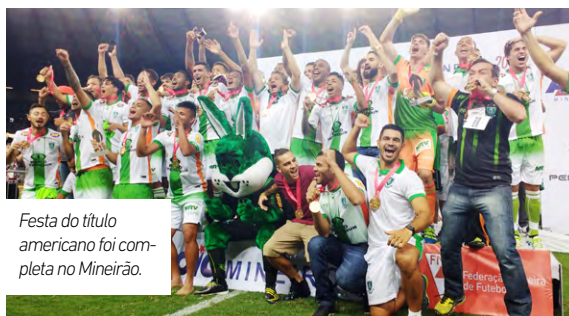
Festa do título americano foi completa no Mineirão.