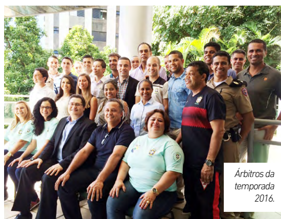
Árbitros da temporada 2016.

Na ocasião os árbitros e assistentes CBF receberam os escudos e uniformes para a temporada 2016.