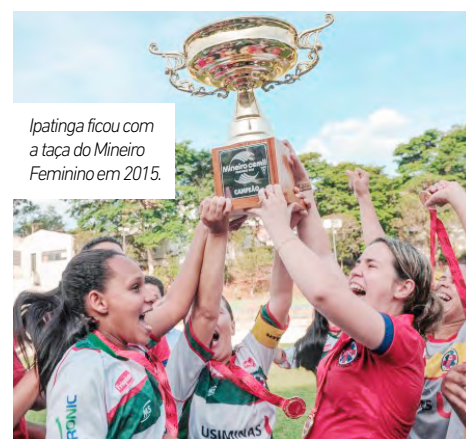
Ipatinga ficou com a taça do Mineiro Feminino em 2015.

e conquistou a taça pela primeira vez em sua história. As vitórias nos dois jogos da final, além de garantir o feito inédito ao time do Vale do Aço, também assegurou uma vaga para a Copa do Brasil, que acontecerá no segundo semestre deste ano.