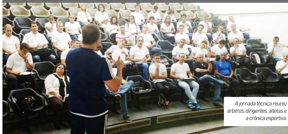
A jornada técnica reuniu árbitros, dirigentes, atletas e a crônica esportiva.

A Escola Nacional de Arbitragem apresentou aos árbitros, dirigentes, atletas e crônica esportiva, as Novas Regras de Jogo 2016/2017.