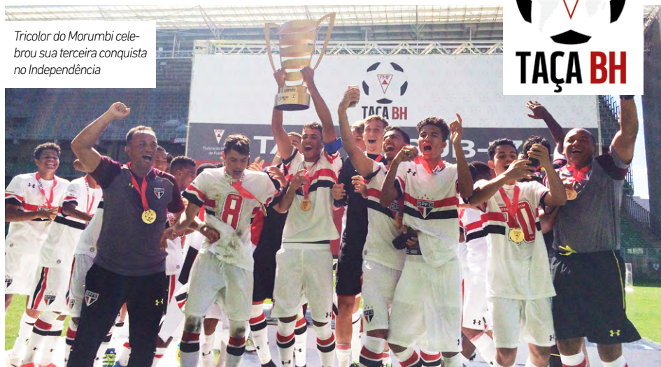
Tricolor do Morumbi celebrou sua terceira conquista no Independência

Palco de mais uma final da Taça BH, a Arena Independência recebeu São Paulo e Palmeiras para o último confronto da competição. A vitória incontestável dos são-paulinos, por 4 a 1, ratificou a soberania da equipe na partida