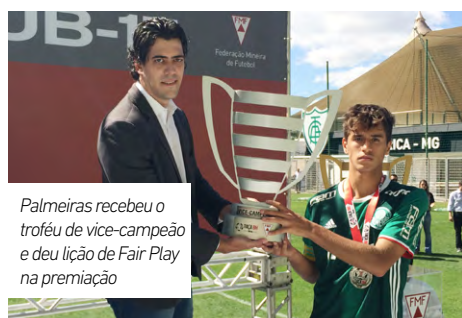
Palmeiras recebeu o troféu de vice-campeão e deu lição de Fair Play na premiação

Olheiros, profissionais do futebol e a equipe de scouting da CBF seguiram de perto a competição do início ao fim. Quem também, mais uma vez, esteve em Minas Gerais para avaliar o desempenho dos atletas, foi o técnico da seleção brasileira sub-17, Carlos Amadeu. O treinador se estabeleceu em Belo Horizonte do início ao fim do torneio, no intuito de acompanhar in loco todo o campeonato.