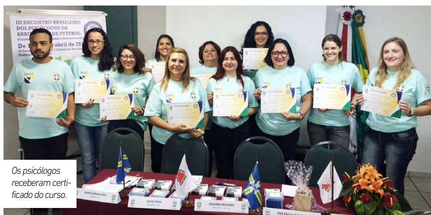
Os psicólogos receberam certificado do curso.