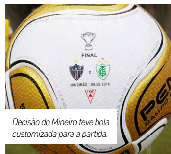
Decisão do Mineiro teve bola customizada para a partida.