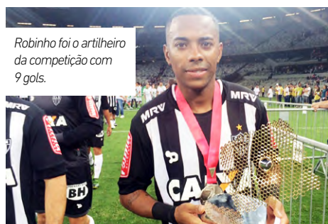
Robinho foi o artilheiro da competição com 9 gols.

Em 2016, o público presente nos jogos aumentou, totalizando 411.575 torcedores. 12 cidades receberam jogos da competição. Foram marcados 173 gols em 72 jogos, média de 2,4 gols por partida. Em sua volta ao futebol brasileiro, Robinho, do Atlético, marcou por 9 vezes e sagrou-se o artilheiro da competição.