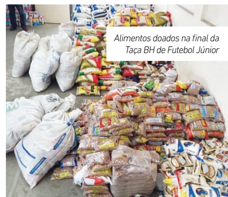
Alimentos doados na final da Taça BH de Futebol Júnior

Este ano a FMF continuará realizando ações beneficentes por todo o Estado, valorizando o nosso esporte e cumprindo o seu caráter social.