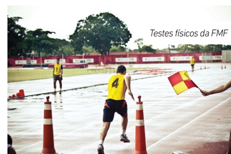
Testes físicos da FMF