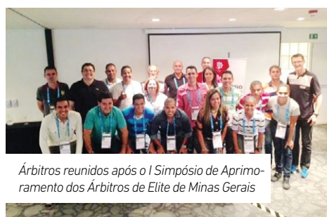
Árbitros reunidos após o I Simpósio de Aprimoramento dos Árbitros de Elite de Minas Gerais