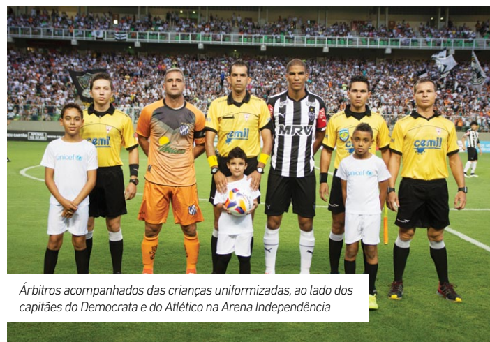
Árbitros acompanhados das crianças uniformizadas, ao lado dos capitães do Democrata e do Atlético na Arena Independência